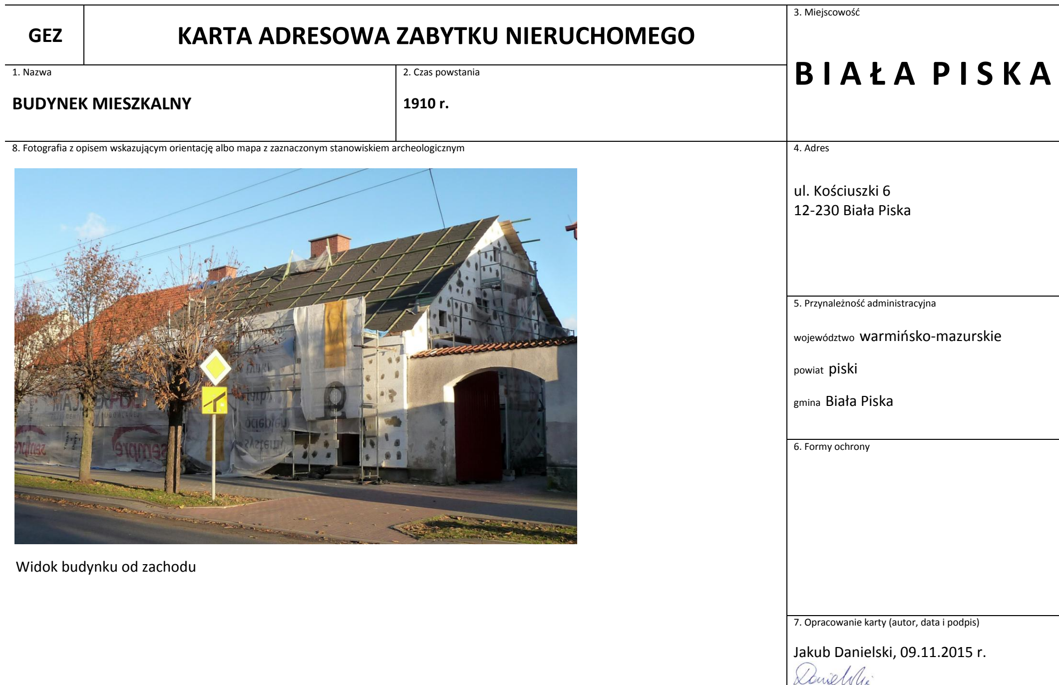
Widok budynku od zachodu